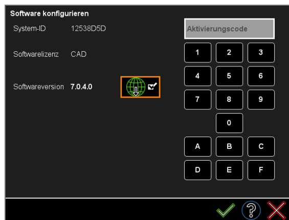
Abbildung 1: Software-Updates herunterladen